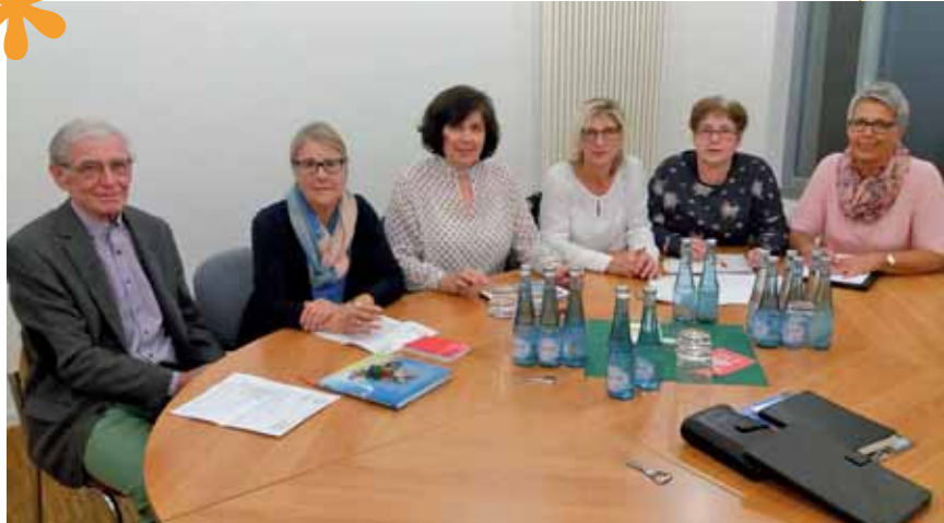
Mitglieder des Ortsausschusses Hachenburg