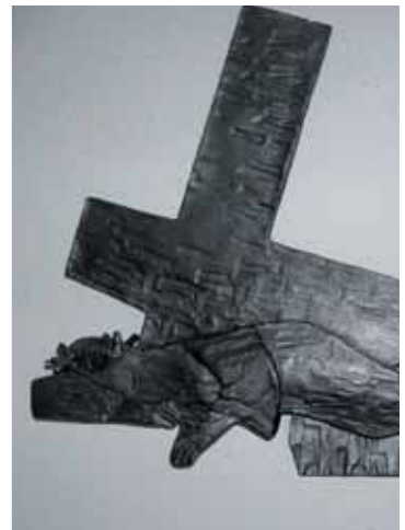
3. Buchstabe Kirchornt = Lösung 9