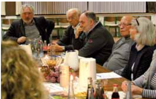
Sitzung des Ortsausschusses Bad Marienberg

In unserem Fall wurden sechs früher selbstständige Pfarreien zu der „ Pfarrrei Maria Himmelfahrt Hachenburg “ zusammengelegt. Da diese Pfarreien zum Teil zwei Kirchen hatten, sind ehemalige Filiationen nun zu Kirchorten geworden. Damit besteht unsere Pfarrrei aus den Kirchorten Bad Marienberg, Hachenburg, Hattert, Marienstatt, Merkelbach, Mörlen, Nistertal und Norken.