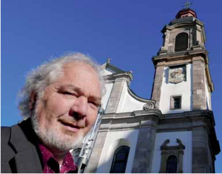
„Viel unterwegs in der Gemeinde...“