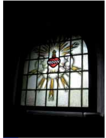
10. Buchstabe Kirchornt = Lösung 12