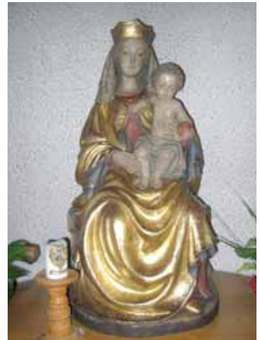
6. Buchstabe Kirchornt = Lösung 11