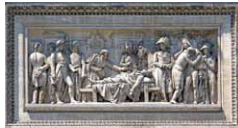
Relief am Arc de Triomphe in Paris, das den sterbenden französischen General Marceau zeigt, der während der Koalitionskriege bei Höchstenbach schwer verwundet wurde.