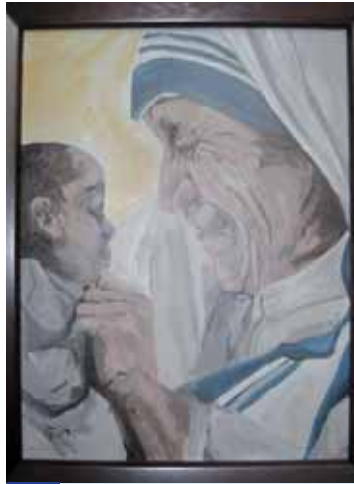
2. Buchstabe Kirchornt = Lösung 19