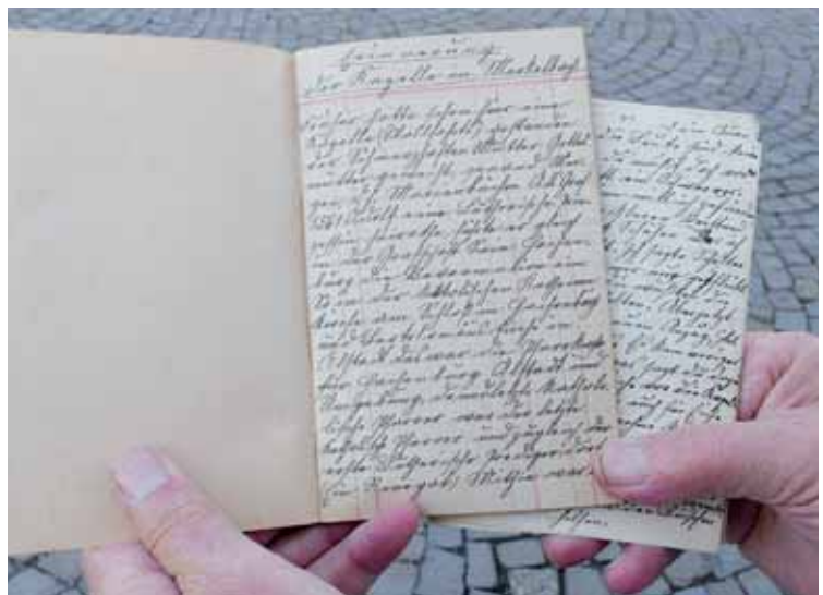
Blick in das Original-Bautagebuch, das Anton Pfeifer führte.